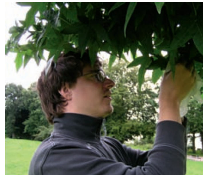
»Begleiterscheinungen«, 2007, Aktion zu den Münster Skulptur Projekten