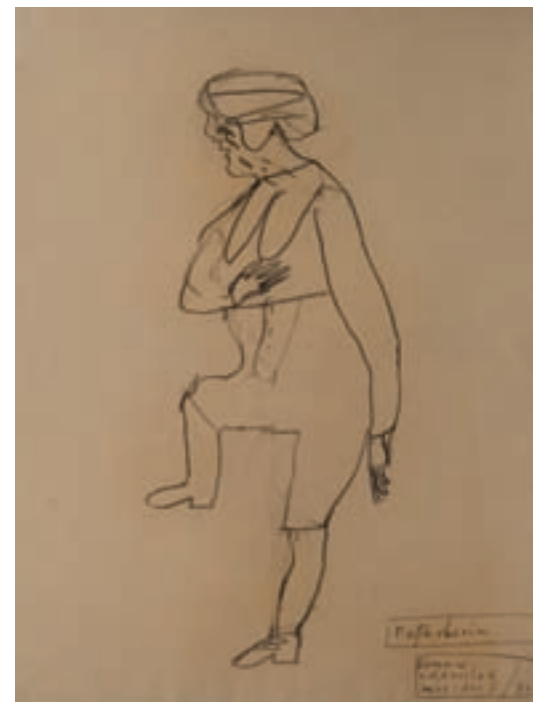
Romane Holderried Kaesdorf »Fußheberin«, 1990, Bleistift/Papier, 62 x 48 cm