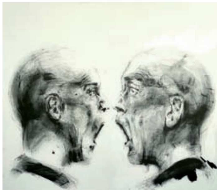
Justine Nessi »two men«