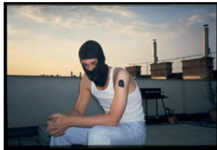
Armin Chodzinski Ohne Titel, Wien, 2001/11, C-Print, 72x105