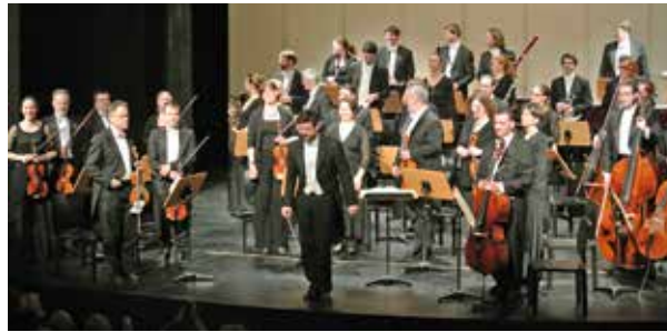
Südwestdeutsches Kammerorchester Pforzheim Leitung: Aurélien Bello