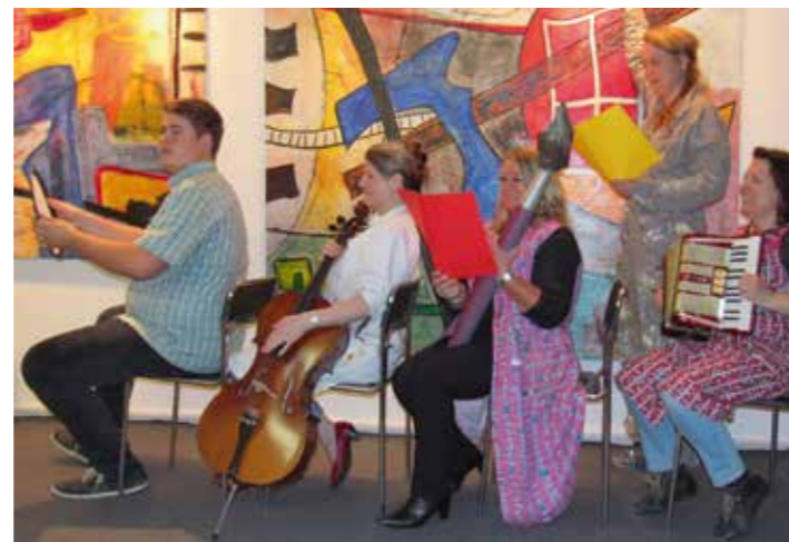
Passagiere werden zu Künstlern.