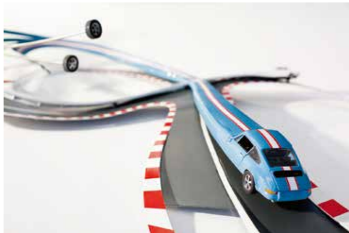
© Galerie Schreffel Stefan Rohrer, 3. Kreuzung, 2014