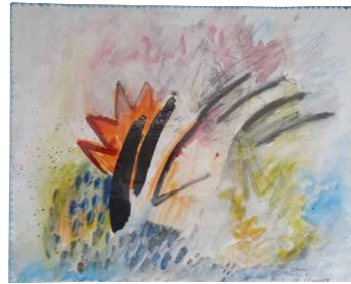
Bruno Demattio-Veesh, A star is born, 1983 Mischtechnik, 72 x 84 cm

im Zeppelin Museum Friedrichshafen Eingang Uferpromenade / Museumsrestaurant Seestraße 22 www.zf.com/kunststiftung