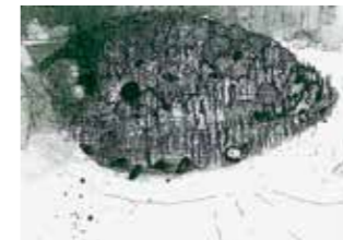
Pjotr Knips/BLR Pierre Dessin/F