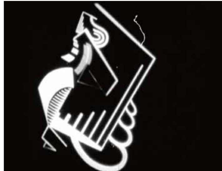
Viking Eggeling, Symphonie Diagonale, 1924