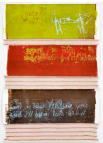
»crucify your mind 2« 2015, 154 x 106 cm Monotypie auf Papier und Stoff