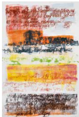
»crucify your mind 1« 2015, 154 x 106 cm Monotypie auf Papier