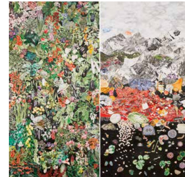
Micha Payer + Martin Gabriel stilleben, kontinentaldrift / geschlossene gesellschaft (expulsion from), 2013/14 Bleistift und Buntstift auf Papier, je 150 x 75 cm

Dan Perjovschi Intervention in die Architektur