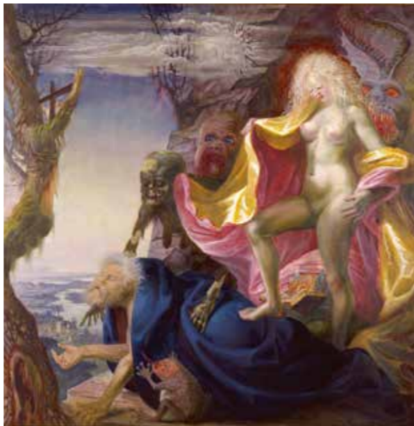
Otto Dix, Die Versuchung des Heiligen Antonius, 1937