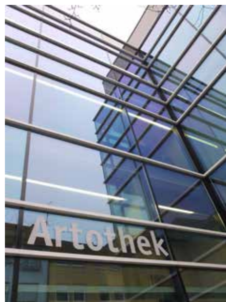
Artothek im Medienhaus am See