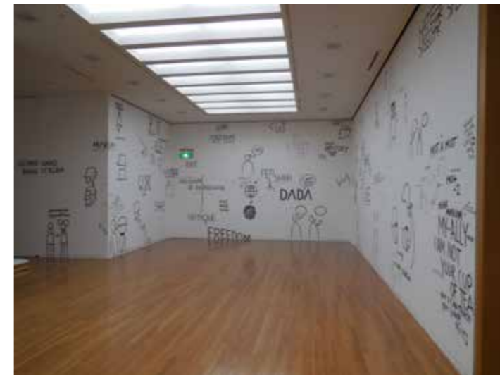
»The Tokyo Drawing« at M0T Museum of Contemporary Art Tokyo 2016

Brigham Baker / Esther Mathis phaenomena materiae – Ein Dialog