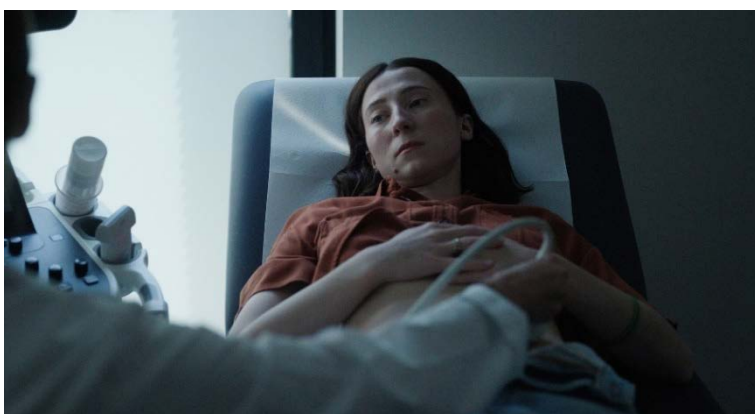
Filmstill The Good Woman , Masha Mollenhauer

Publikumspreis 2026: The Good Woman , von Masha Mollenhauer